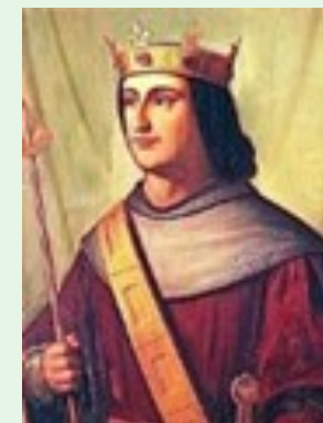
Philippe VI (1293-1350)